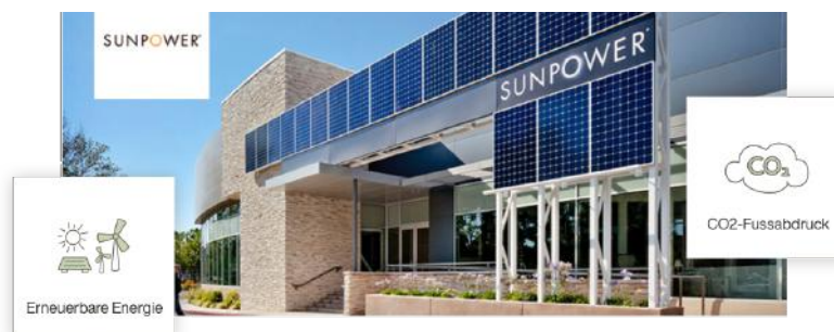
Abbildung 4: SunPowerCorp., eine Firma aus dem Yova-Universum

Wichtig ist auch, dass wir keinen Mindest-ESG-Schwellenwert für kleine Unternehmen im Yova-Universum festlegen. Wie bereits erwähnt, haben ESG-Daten ihre Schwachstellen - und sie bestrafen typischerweise junge und innovative Unternehmen wie Tesla und SunPowerCorp.