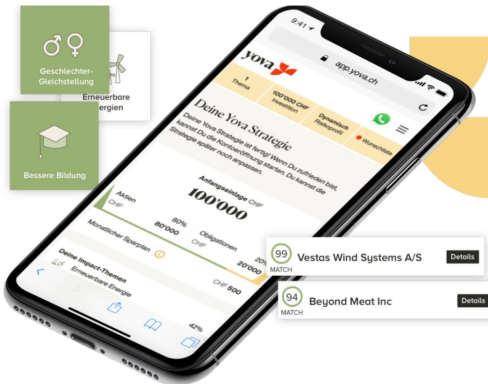
Abbildung 3: Ein Screenshot einer Yova Impact Investmentstrategie

“Ein Unternehmen muss auch unsere strengen finanziellen Kriterien erfüllen, um in das Yova-Universum zu gelangen.”