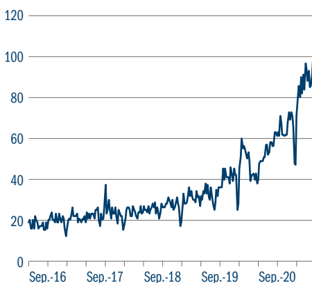
Abbildung 1: Google Analytics-Ergebnisse zu ESG-Begriffen

Die Zahlen repräsentieren das Suchinteresse im Verhältnis zum höchsten Punkt der Grafik für die betreffende Region und Zeit. Ein Wert von 100 entspricht dem höchsten Beliebtheitsgrad. Ein Wert von 50 bedeutet, dass der Begriff im Verhältnis nur halb so beliebt ist. Ein Wert von Null bedeutet, dass zu diesem Punkt nicht ausreichend Daten vorhanden waren.